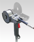
Pištolj sa bakljom