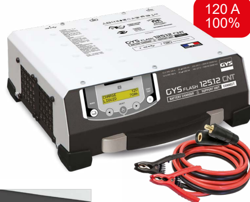
Kábelekkel szállítva (5 m - 25 mm 2 )