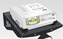
Fali polc 055513