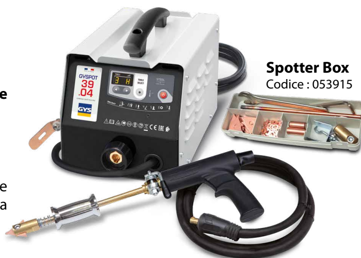
Spotter Box Codice : 053915

Il sistema di saldatura è generato automaticamente da un semplice contatto tra lo strumento e il pezzo da lavorare.