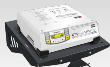
Sieninė lentyna 055513