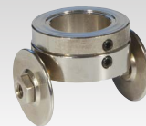
Ratiņi deglim MT-70 037977