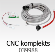
CNC komplekts 039988