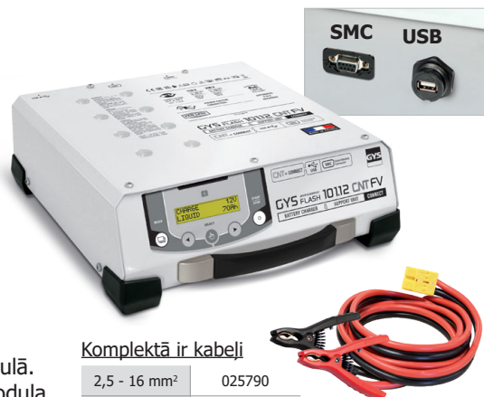
Komplektā ir kabeļi