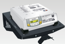
Sienas plaukts 055513