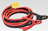
8 m - 16 mm 2 056572