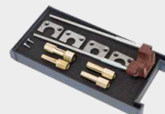
Kaste ar paligmateriāliem LOKA VILKŠANAI 700 068322