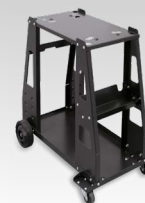
PLASMA 600 ratiņi 040298