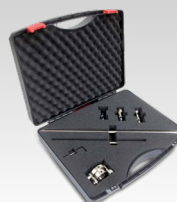
Kompasa komplekts 040205