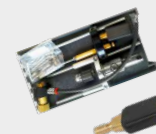
Kaste ar palīgmateriāliem 068452