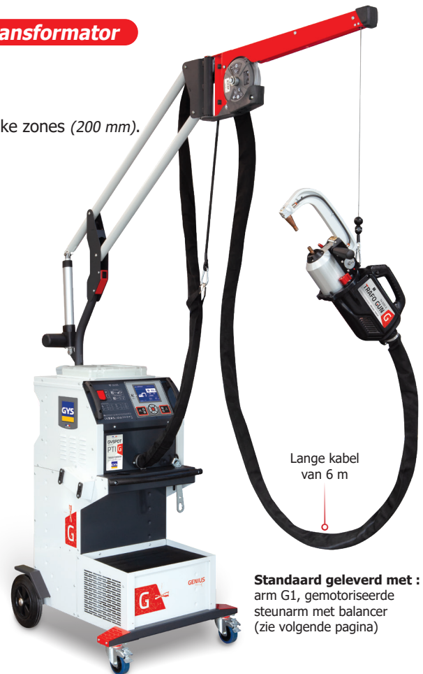
Lange kabel van 6 m

Standaard geleverd met : arm G1, gemotoriseerde steunarm met balancer (zie volgende pagina)