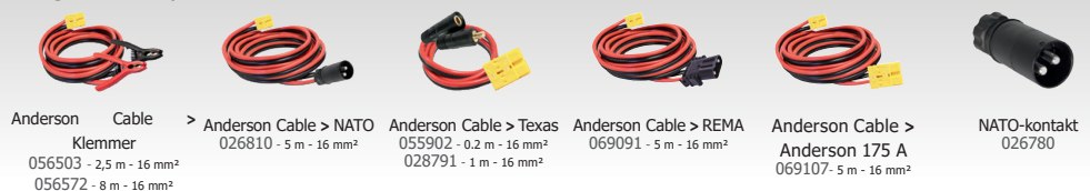
Anderson Cable > Klemmer 056503 - 2,5 m - 16 mm 2 056572 - 8 m - 16 mm 2