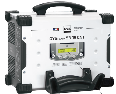
Intuitivt grensesnitt tilgjengelig på 22 språk