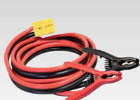
8 m - 16 mm 2 056572