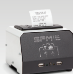
SPM : Printermodul 026919