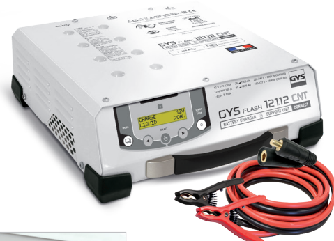
Levert med kabler (5 m - 25 mm 2 )