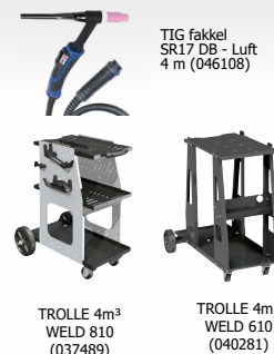
TROLLE 4m 3 WELD 810 (037489)