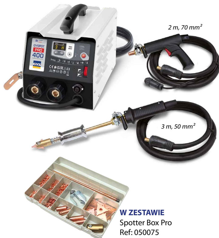
W ZESTAWIE Spotter Box Pro Ref: 050075

Zasilanie: 8 m Uziemienie: 2 m Pistolet: 2 m 3 m