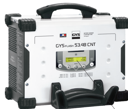
Interface intuitiva disponível em 22 idiomas