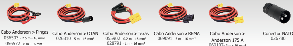
Cabo Anderson > Pinças 056503 - 2.5 m - 16 mm 2 056572 - 8 m - 16 mm 2