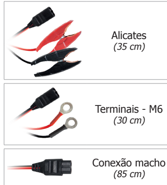
Alicates (35 cm)