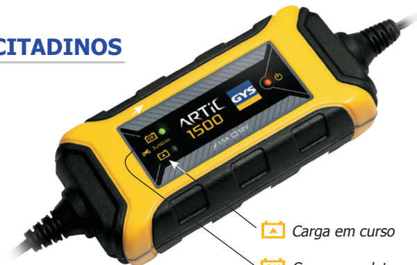
Carga em curso Carga completa