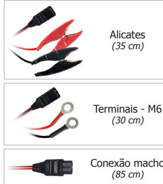
Alicates (35 cm)