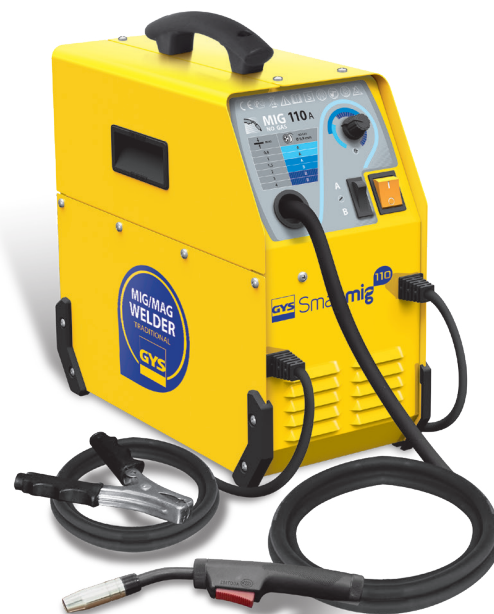
Livré avec câble de masse et torche fixe 2,2m.

1 processo : NO GÁS para a soldadura mesmo ao ar livre. Arame tubular Ø 0,9 mm (kit no gaz : 041240)