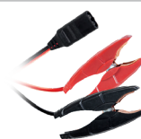
Cleme (35 cm)