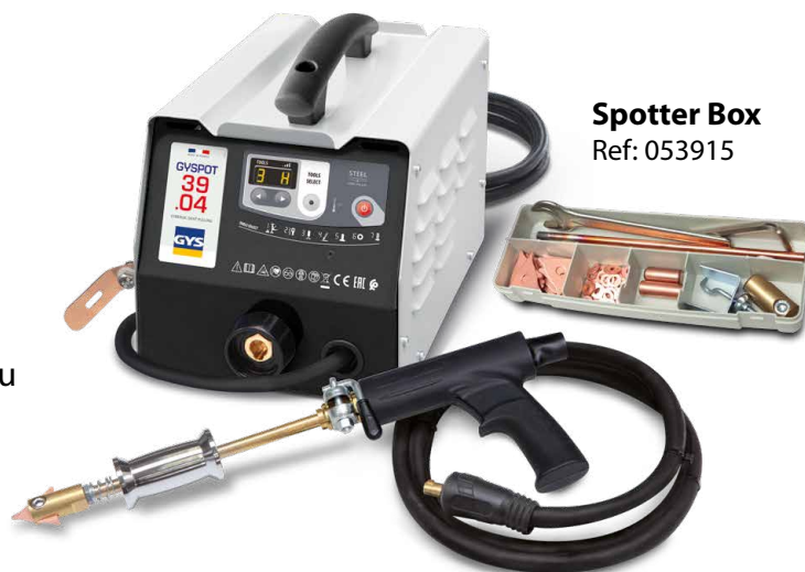
Spotter Box Ref: 053915

Sudarea este declanșată automat printr-un simplu contact între sculă și piesa de îndreptat.