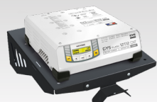
Полка с настенным креплением 055513