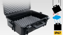
Кейс для транспортировки 060432