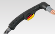
Horák MT-70 manuálny 70 A (50%) 6 m - 037502 12 m - 037519