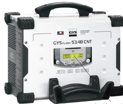
Intuitívne rozhranie k dispozícii v 22 jazykoch