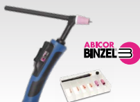
SR26DB - 4 m 038271