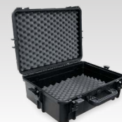
Puzdro na mieste IP67 060432