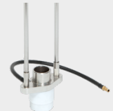
Vidlica s plynovým tienením 068346