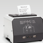
SPM : tiskalniški modul 026919