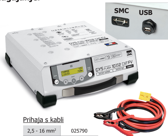
Prihaja s kablji