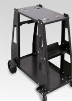
Voziček PLASMA 600 040298