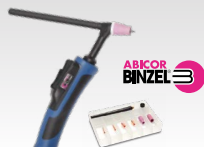
SR26DB - 4 m 038271