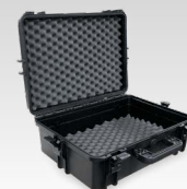
On-site väska IP67 060432