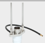
Gaffel med gasskydd 068346