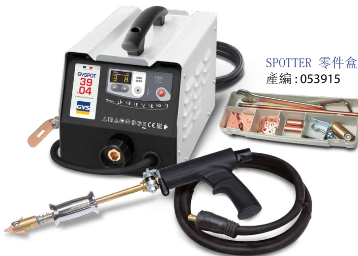
SPOTTER 零件盒 產編 : 053915