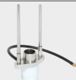
Вилка з газовим захистом 068346