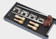
Коробка витратних матеріалів для ARCPULL 700 068322